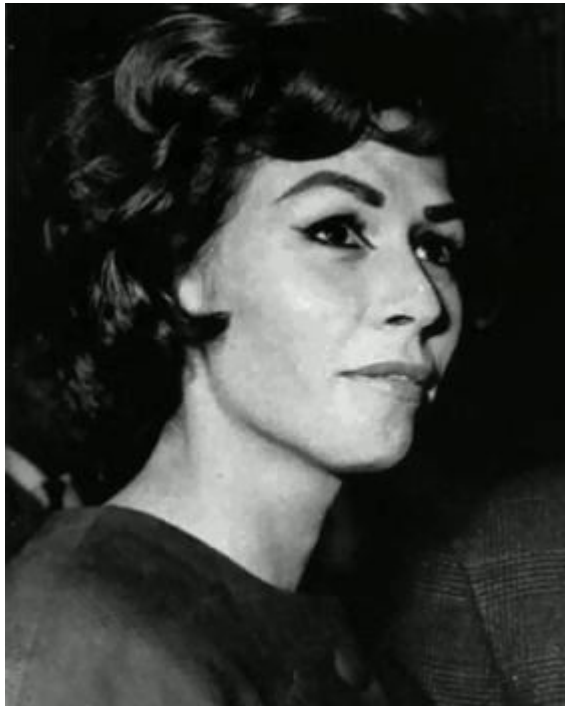
Shirley Pitts du gang fÃ©minin des 40 Ã©lÃ©phants

plus Ã¢ges vite remplacÃ©es par de jeunes et jolies venant des classes basses de la sociÃ©tÃ©, tout cela Ã© une Ã©poque oÃ¹ lâ'ascenseur social en Angleterre Ã©tait quasi impossible pour une femme. La derniÃ¨re reine connue des 40 Ã©lÃ©phants fut Shirley Pitts dÃ©cÃ©dÃ©e en 1992 et qui, mÃªme si elle avait raccrochÃ© depuis longtemps, aurait Ã©tÃ© enterrÃ©e avec une robe de Zandra Rhodes de 5000 livres sterlingâ?non payÃ©e ! Les tabloÃ¯ds anglais ont rapportÃ© la rÃ©action de la crÃ©atrice qui avait dÃ©clarÃ© que Ã©« câ?Ã©tait un honneur Ã© » !