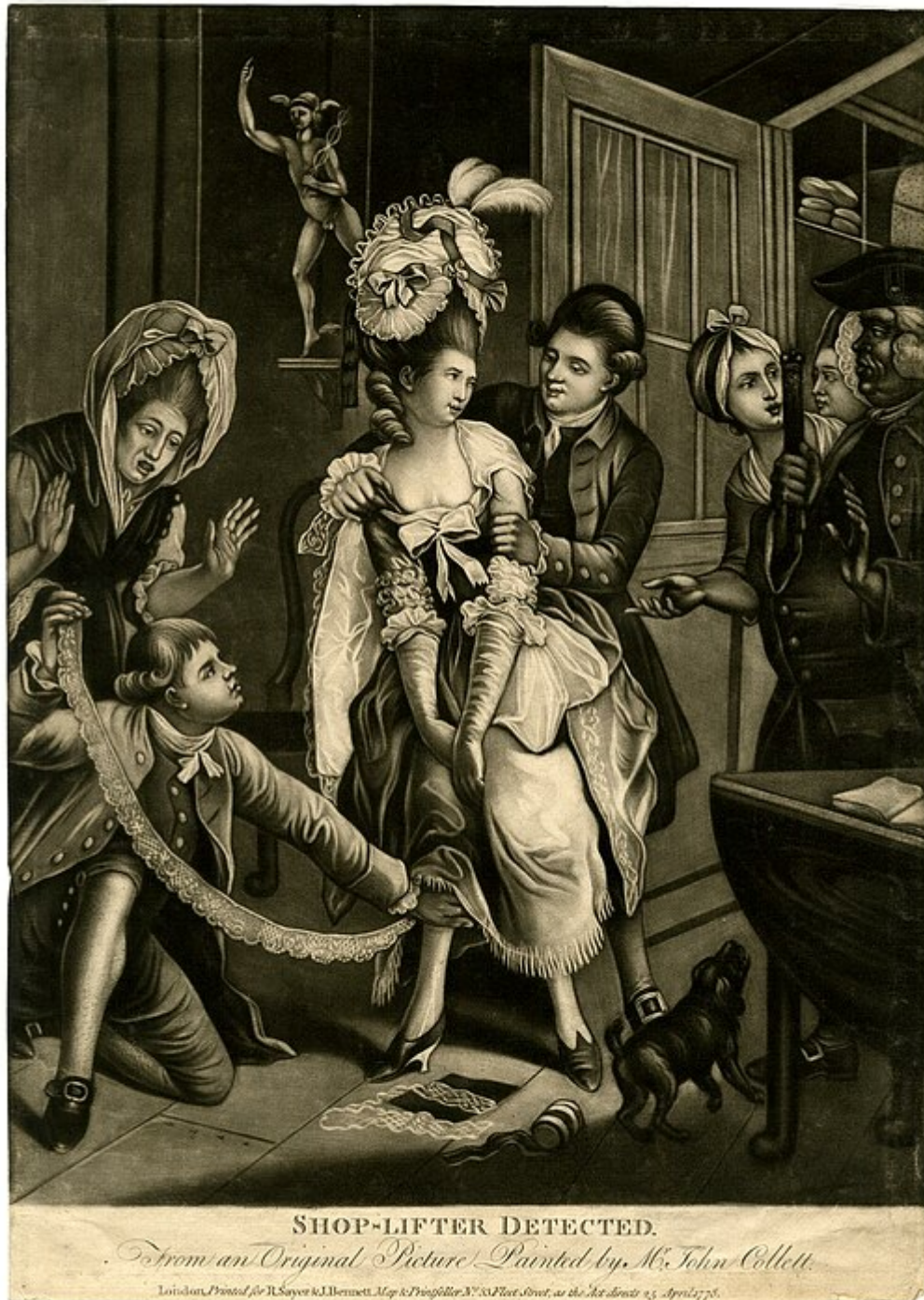
Shoplyfter detected

Et, même si certaines voleuses de haut vol sont restées dans les mémoires anglaises, comme Moll King ayant été incarnée sur grand écran par Robin Wright dans le film la sordide histoire de Moll King ; les journaux en Grande-Bretagne et en Amérique ont développé une fascination toute aussi grande pour les 40 Éléphants, un gang de voleuses à l'étalage considérées comme des aristocrates du crime. Ce gang a sévi durant plus de deux cents ans, mais sa période de "gloire" fut de la fin du XIXème jusque dans les années 50 et avec une toute puissance dans l'entre-deux-guerres. Leur nom fut cité pour la première fois dans un journal en 1873, mais selon les archives policières le gang existait