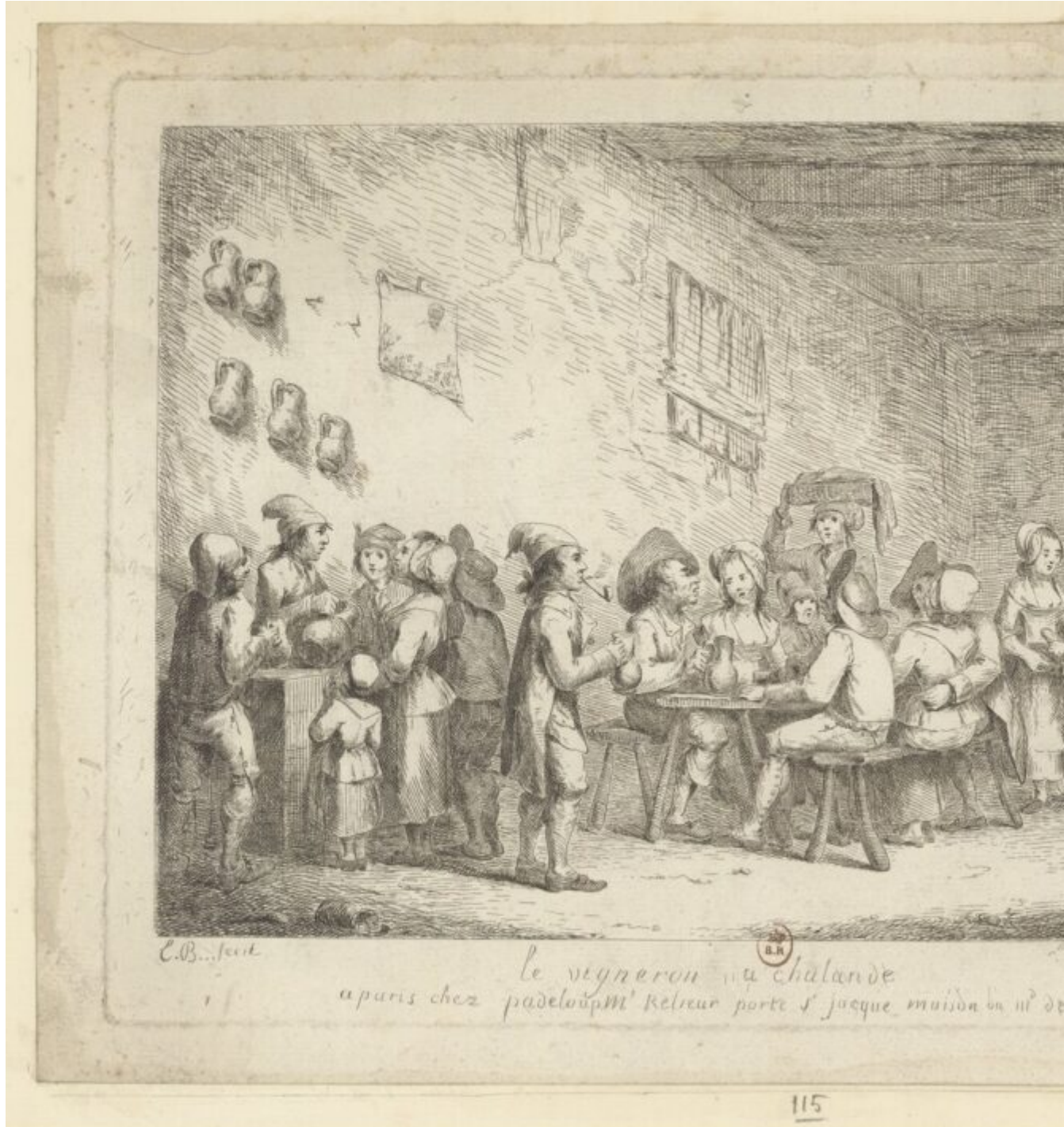
Le vigneron achalandé (Gallica)

achalandé [Image fixe]: [estampe]/E. B... fecit/publication : a paris chez padeloup. Mt Relieur porte st jacque maison du IIIe (md) de planche, [avant 1665]/1 est. : eau-forte ; 24,1 x 35 cm (élt. d'impr.)/Catalogue des estampes, dessins et cartes de la Bibliothèque de l' Arsenal : Catalogue des estampes, dessins et cartes de la Bibliothèque de l' Arsenal Autre(s) titre(s) : Titre selon Schéfer : [Scènes de cabaret] (..) «