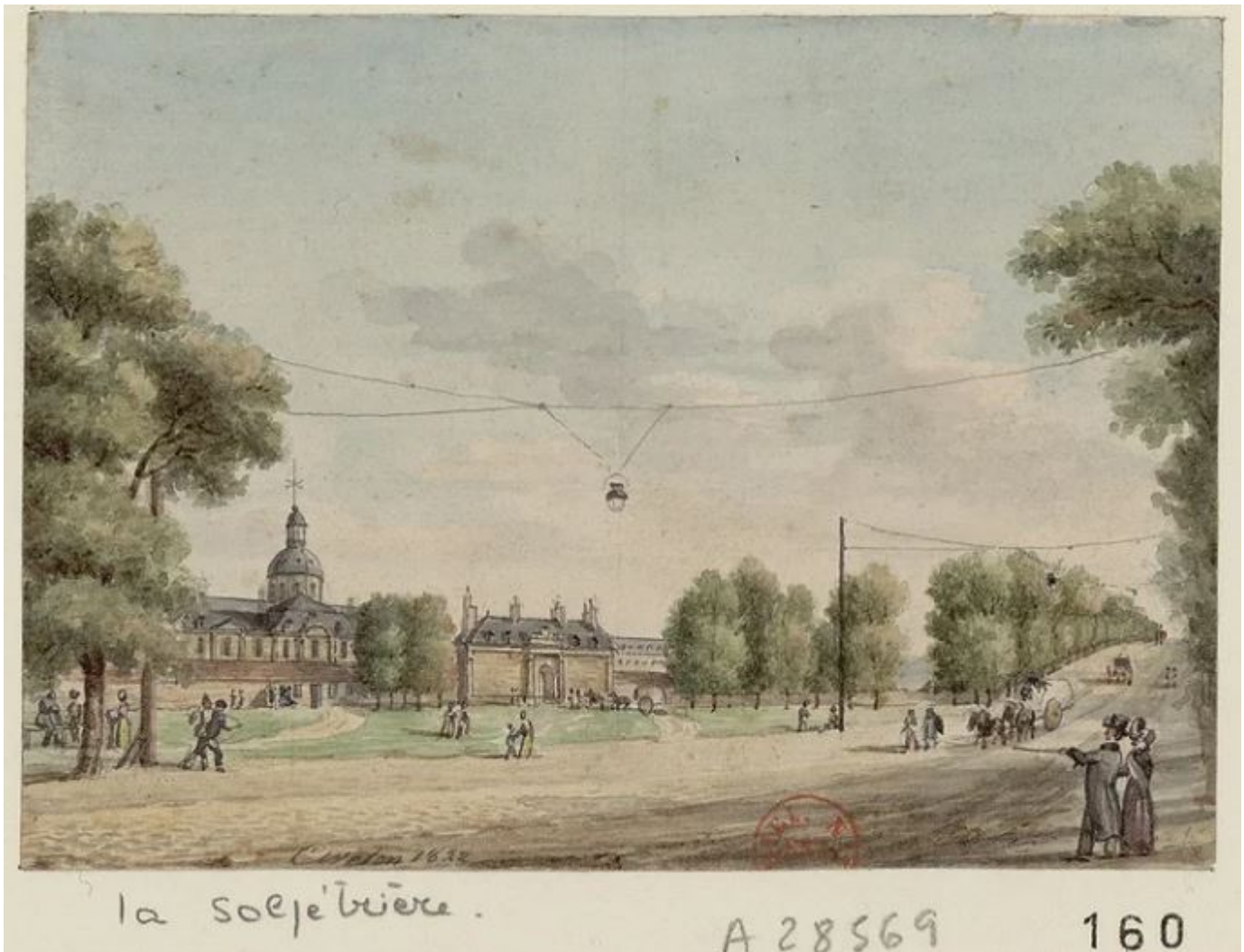
Christophe Civeton, La Salpêtrière, 1822 (Gallica)